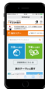
<スマートフォン画面のイメージ>

提携旅行会社数の増加に伴う比較サイトとしての機能向上はもちろん、旅行選びの際に役立つ知識や各国の基本情報や観光情報なども順次公開していく予定です。また添乗員同行であることのメリットや利便性を伝えるコンテンツ、添乗員同行だからこそ実現できるツアーの特集など、「テンツキ旅行」ならではの独自コンテンツも拡充予定です。